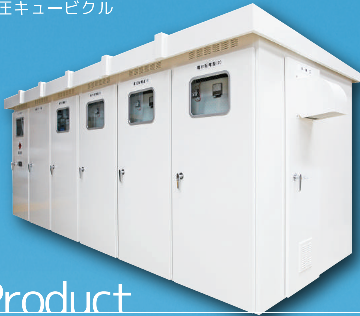
高圧キュービクル